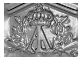
(c) Rendu de la façade de l'église Val de grace après triangulation.